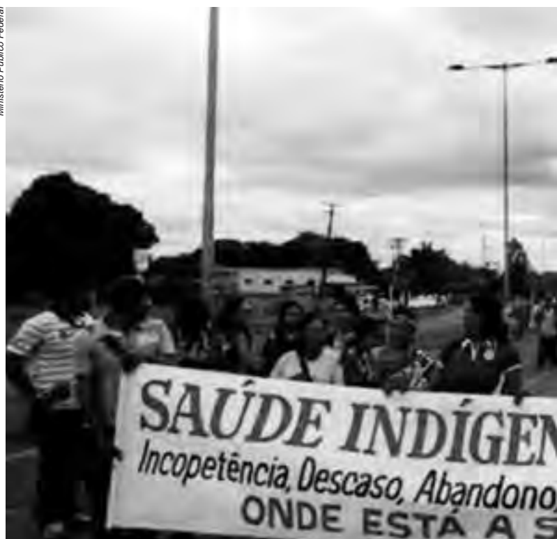
Em protestos em todo o país, os povos questionam o destino dos recursos direcionados à saúde