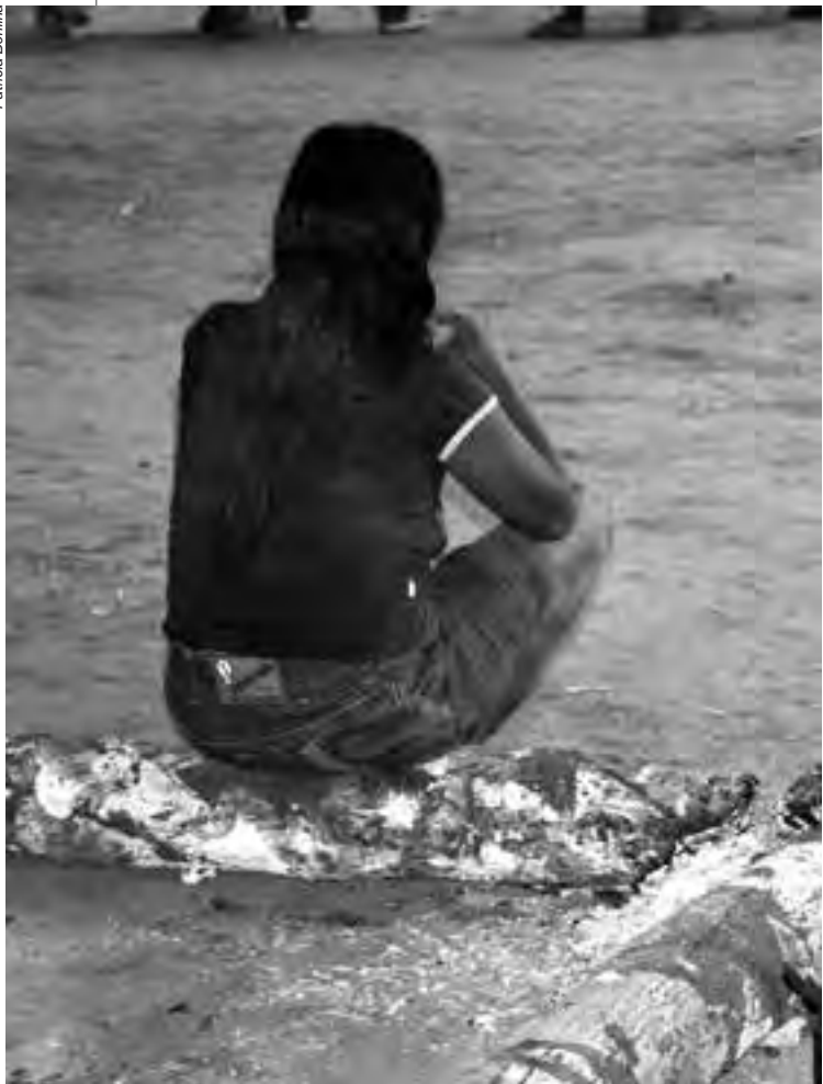
Grave violação de direitos humanos, a violência sexual também impacta as populações indígenas