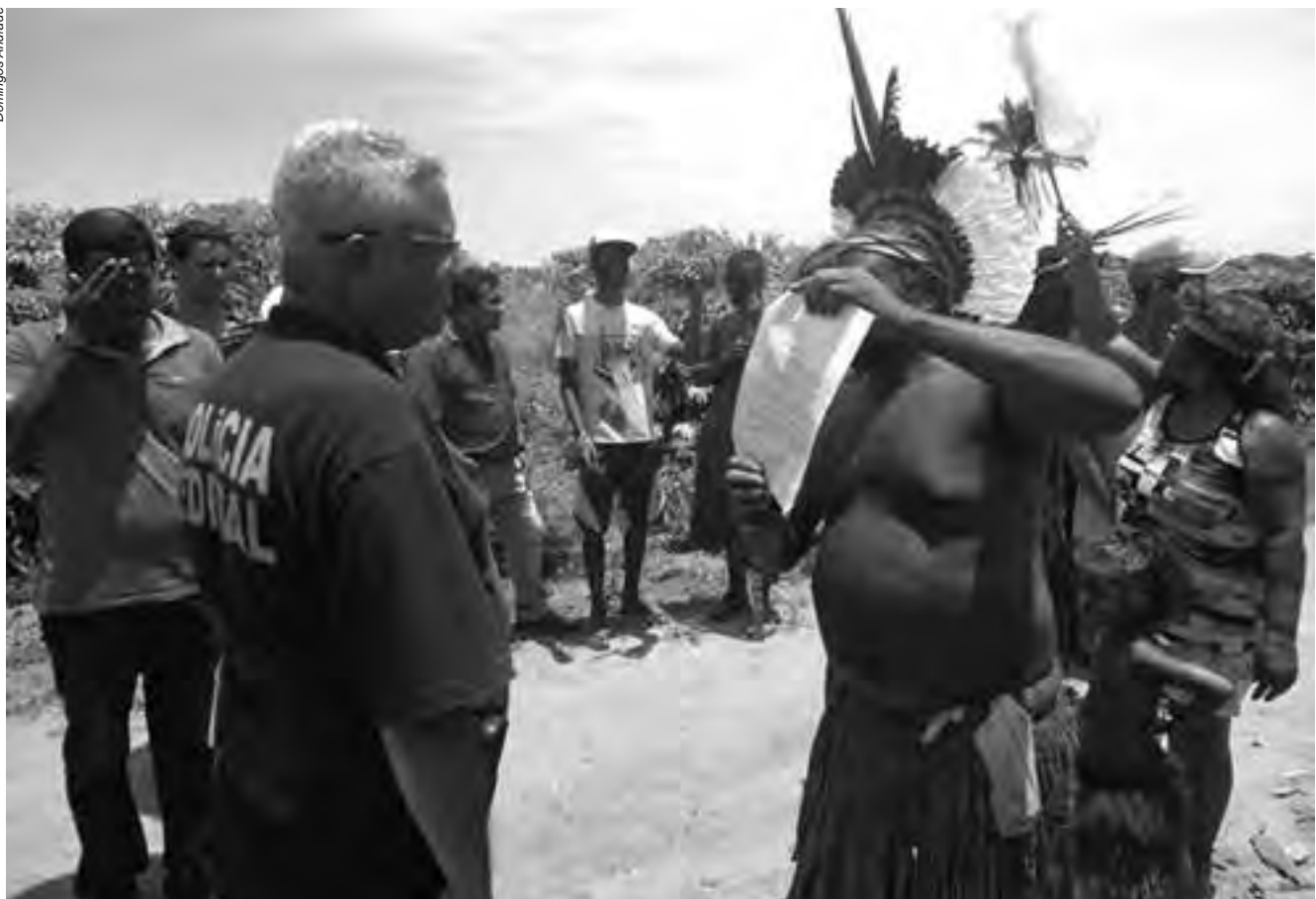
Cada vez mais os territórios indígenas são alvo do interesse de grupos econômicos e políticos que não se constringem em utilizar a força física para garantir o acesso e a exploração de seus bens naturais

No estado da Bahia, o povo Pataxó, da Terra Indígena Barra Velha, foi alvo de uma ação truculenta de forças policiais na execução de uma reintegração de posse. Segundo denunciaram os Pataxó, efetivos das polícias Federal, Civil e Militar dispararam balas de borracha e bombas de gás lacrimogêneo sobre os indígenas. Segundo relatos, não foram poupadas crianças, mulheres, nem idosos. Muitas pessoas tiveram de se refugiar nas matas para fugir do ataque policial. O conflito ocorreu devido à morosidade do poder público em reconhecer o território indígena. A Terra Indígena Barra Velha do Monte Pascoal, situada nos municípios de Porto Seguro, Prado e Itamaraju, região do extremo sul da Bahia, é área tradicionalmente ocupada pelos Pataxó, conforme vários relatos históricos desde 1.500, e tem um território de 8.627 hectares delimitado e homologado, conforme processo realizado pela Funai. Entretanto, os indígenas reivindicam 52.748 hectares, área que incide no Parque Nacional do Monte Pascoal, sobreposto à terra indígena.