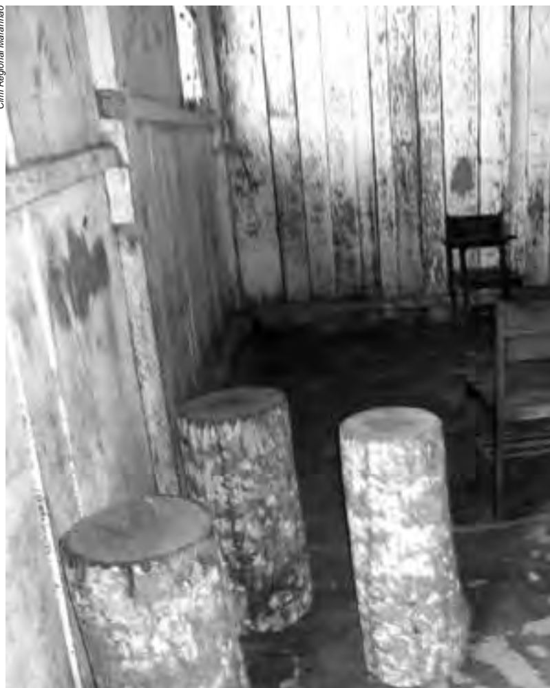
A falta de estrutura, segurança, iluminação, salubridade, espaço, transporte, material pedagógico