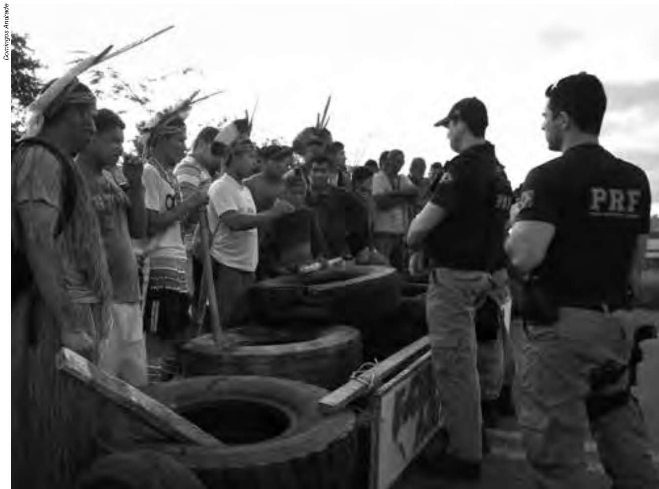
Mesmo diante do contexto mais desafiador desde a promulgação da Constituição Federal, há 25 anos, os povos indígenas não desistem da luta pelas suas terras sagradas

FONTE: Combate Racismo Ambiental, 25/11/2014