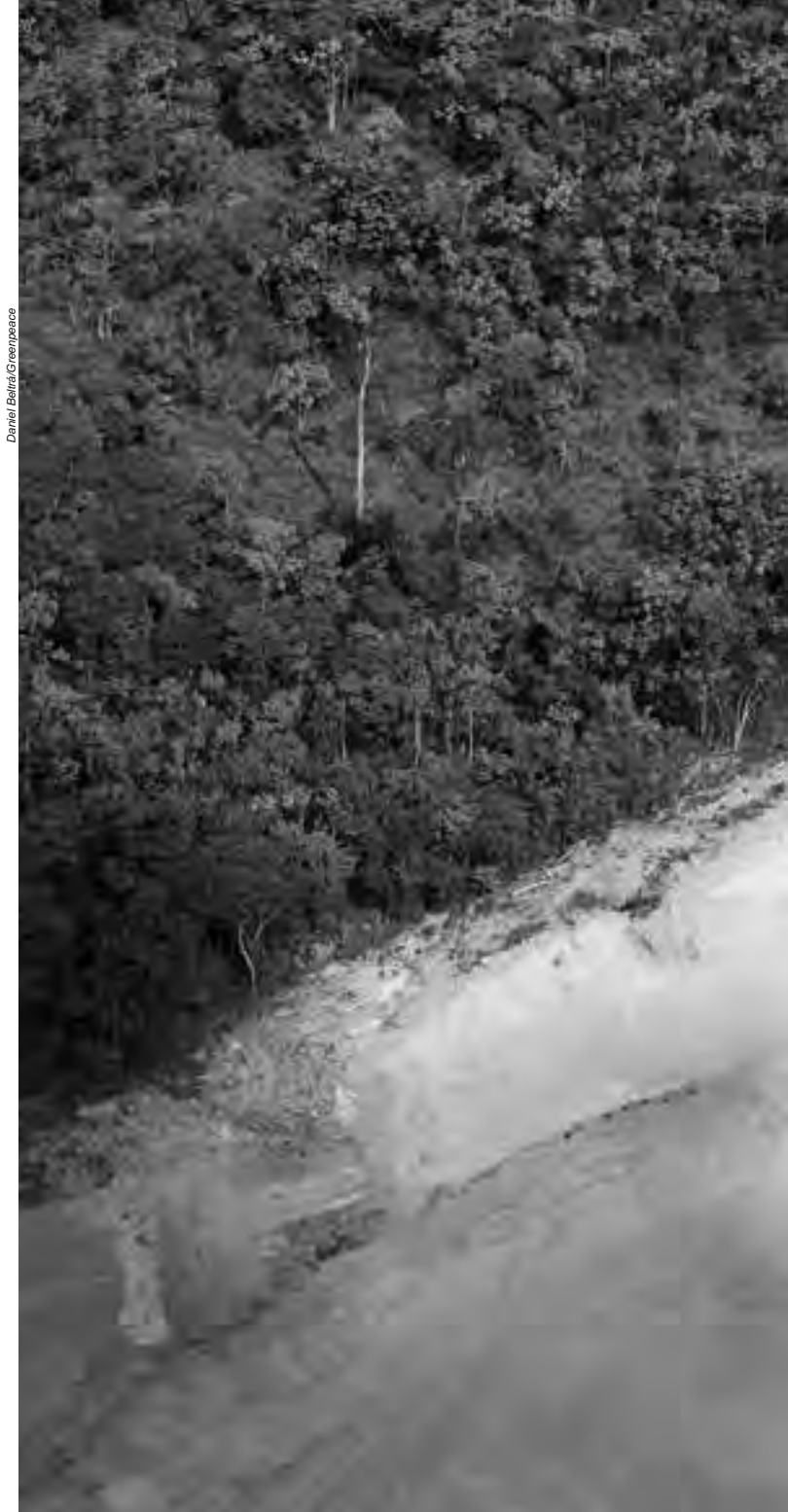
Idealizada pelos militares, a hidrelétrica de Belo Monte é emblemática no sentido de

No Brasil esse mito da felicidade “material” está associado a outro, que diz respeito à busca de novos espaços para a expansão do “desenvolvimento”. Ou seja, busca-se constantemente avançar para os “novos” territórios, locais onde ainda existe natureza a ser explorada e apropriada. Nesse aspecto, ao interesse do capital, as terras indígenas e de comunidades tradicionais são espaços privilegiados para a implantação dessas obras