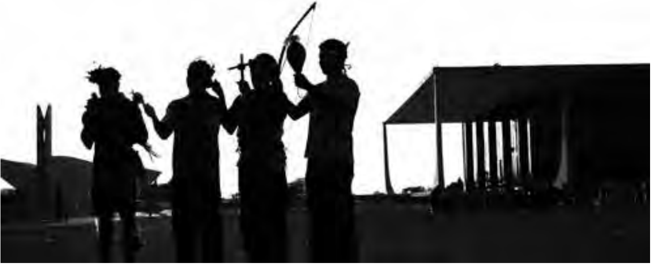
Recentes decisões do Judiciário consideram e tratam os povos como se eles ainda fossem tutelados pelo Estado, afrontando a própria Constituição Federal do país

“esbulho renitente”. Na esteira do ataque frontal ao direito fundamental dos povos às suas terras, estas decisões da 2ª Turma do STF também restringem drasticamente o conceito de “esbulho renitente”. De acordo com as referidas decisões, somente a “existência de situação de efetivo conflito possessório” na data da promulgação da Constituição configuraria a ocorrência de “esbulho renitente”. De forma ainda mais afunilada e fundamentalista, a 2ª Turma do Supremo diz que “esse conflito deve materializar-se em circunstâncias de fato ou controvérsia possessória judicializada”.