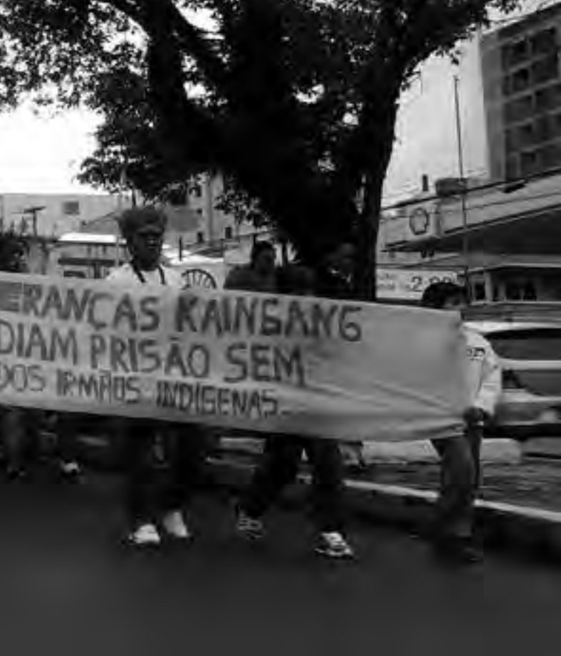
Privilegiados, que não poupam os indígenas de situações de extrema violência

e demarcação de suas terras. Os conflitos com o Estado e com particulares não são diferentes dos que ocorrem nas outras regiões do país e a criminalização se assemelha às demais. No conflito com particulares, ante a violenta omissão do Estado, um jovem indígena foi mantido refém por não indígenas e, no confronto, dois agricultores foram mortos. Cinco lideranças, entre elas o cacique, o vice-cacique e o filho do pajé, foram presas sem nenhum indício de prova e, pior, sem nem estarem no local do confronto quando este ocorreu. A soltura foi determinada pelo ministro Rogério Schietti Cruz, do Superior Tribunal de Justiça (STJ) 12 .