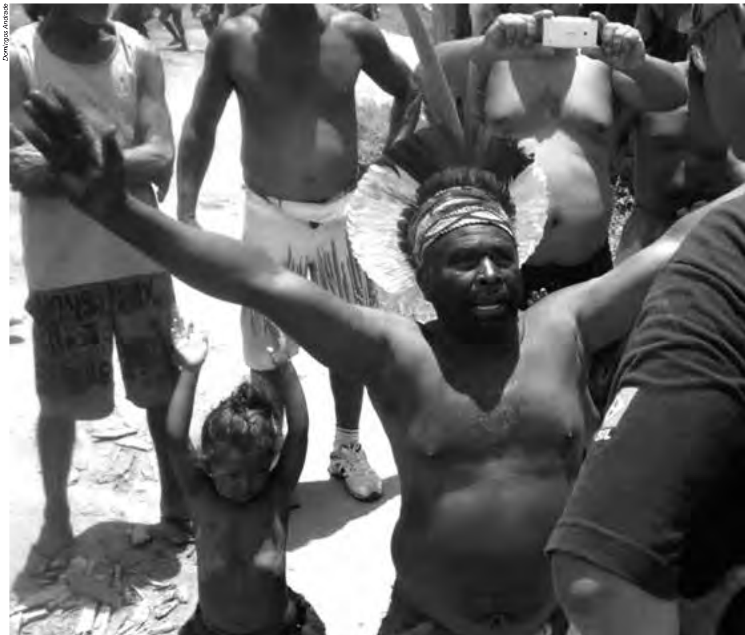
No Brasil, de modo geral, ainda não há a compreensão de que os direitos das minorias devem ser respeitados e os deveres constitucionais cumpridos; as terras tradicionais

pesado, cavalaria montada, 70 viaturas, policiais acompanhados de cães, helicópteros e Corpo de Bombeiros. Assim como ocorreu na ocasião da prisão de cinco lideranças, que nem estavam no local do confronto, o Grupo RBS e outros veículos de imprensa estavam acompanhando a polícia. Por outro lado, inexplicavelmente, o órgão indigenista estatal não foi informado da megaoperação na área indígena. Os policiais adentraram as casas a partir das seis horas da manhã, mas não encontraram nada. Levaram o veículo de um morador da aldeia e fotografaram todos os homens da comunidade, incluindo os adolescentes. Além disso, obrigaram todos a fornecer saliva, possivelmente para a realização de análise genética.