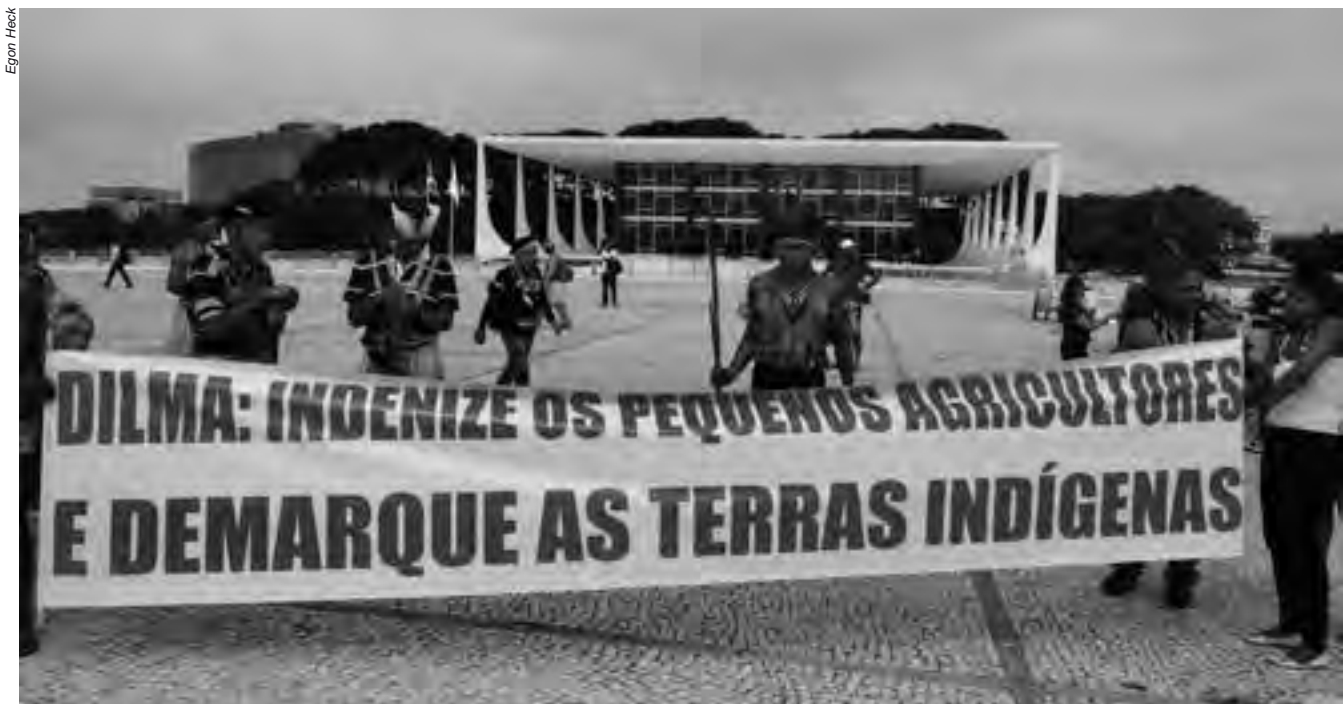
A morosidade para devolver aos povos indígenas as suas terras tradicionais causa o acirramento de conflitos mesmo em áreas em que a situação já está pacificada

DESCRIÇÃO: O procedimento de demarcação se arrasta há 13 anos. Em 2001, a presidência da Funai constituiu o primeiro grupo técnico para realizar estudos na identificação das aldeias Mun-