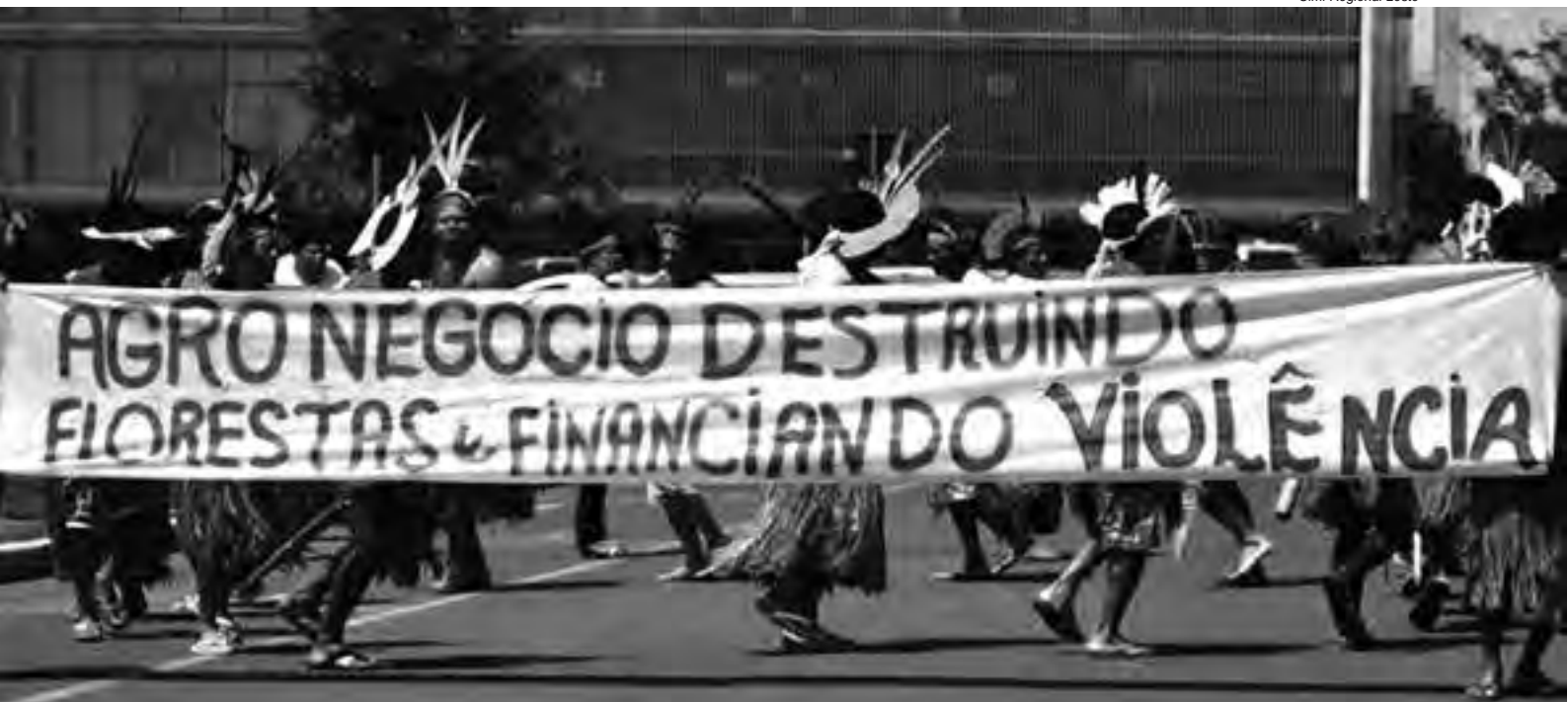
A destruição das florestas, águas, flora e fauna é parte do mesmo projeto que objetiva a eliminação dos povos e das comunidades tradicionais do Brasil