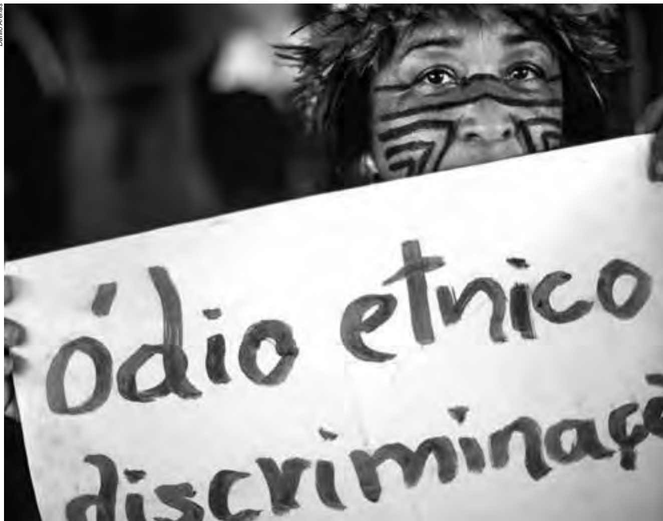
O discurso da democracia racial contribuiu para camuflar por muito tempo o racismo, as desigualdades e os conflitos étnico-raciais no Brasil

No Amazonas, desde o final de 2013, vêm sendo veiculadas pela imprensa e nas redes sociais notícias com conteúdo discriminatório e incitação ao ódio contra o povo indígena Tenharim. Um dos agressores, administrador de uma página no Facebook, entre outras afirmações, chama os indígenas de “bandidos” e reconhece a existência de “ódio contra os Tenharim”. O MPF tomou medidas no sentido de obrigar a remoção de mais de 30 publicações na página, identificadas como incitação ao ódio contra a etnia, práticas criminosas, generalização de responsabilidade por crime e discurso injurioso contra defensores dos direitos indígenas.