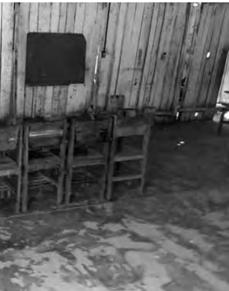
e de professores e funcionários é comum a muitas escolas indígenas no Brasil

DESCRIÇÃO: Para atender os alunos de dez comunidades indígenas, apenas uma comunidade tem estrutura de escola construída. As aulas são ministradas em pequenos espaços, na casa dos professores ou na casa de festa, a maioria com acomodação