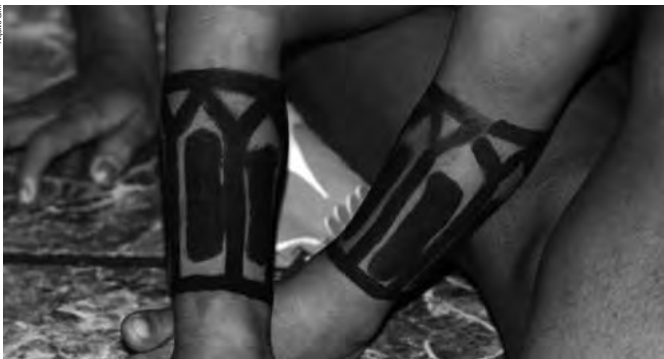
A taxa de mortalidade infantil de indígenas é muito superior à da média nacional. Enquanto entre os Xavante ela foi de 141,64 por mil nascidos, a média no país em 2013 foi de 17 por mil