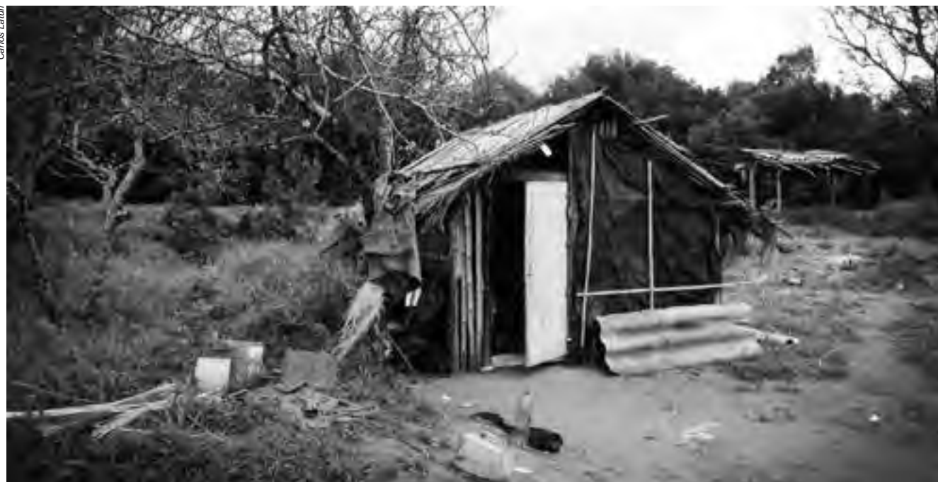
Algumas comunidades indígenas vivem em condições desumanas, sem acesso à água, eletricidade, alimentos, moradia decente, possibilidade de plantar para garantir a sobrevivência e sem quaisquer outros tipos de assistência

No Mato Grosso, médicos denunciam o péssimo estado da estrada que sai da BR-070, km 98, e segue na direção das aldeias. Durante a época das chuvas, nos pontos críticos, há risco de acidente durante as remoções de doentes graves que necessitam de internamento hospitalar. Com o aumento da chuva é impossível transportar doentes, crianças com infecções pulmonares e intestinais, com desidratação e gestantes, podendo ocorrer mortes por impossibilidade de transporte. Há, ainda, um controle de atendimento clínico e de exames laboratoriais da epidemia de diabetes mellitus tipo 2, com mais de 200 casos, a maioria em uso de insulina. Com a impossibilidade da passagem de veículos, a chegada de medicamentos, como insulina e seringas descartáveis aos postos, fica comprometida.