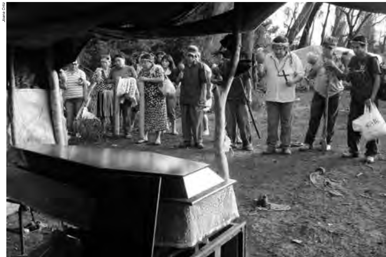
A pequena comunidade de Apyka'i, uma das mais vulneráveis do Brasil, soma oito mortes por atropelamentos em um período de 15 anos; na maior parte dos casos, os motoristas fugiram sem prestar socorro

Um dos indígenas atropelados, do povo Guarani-Kaiowá, trabalhava na colheita de maçã, no município Lebon Régis, em Santa Catarina.