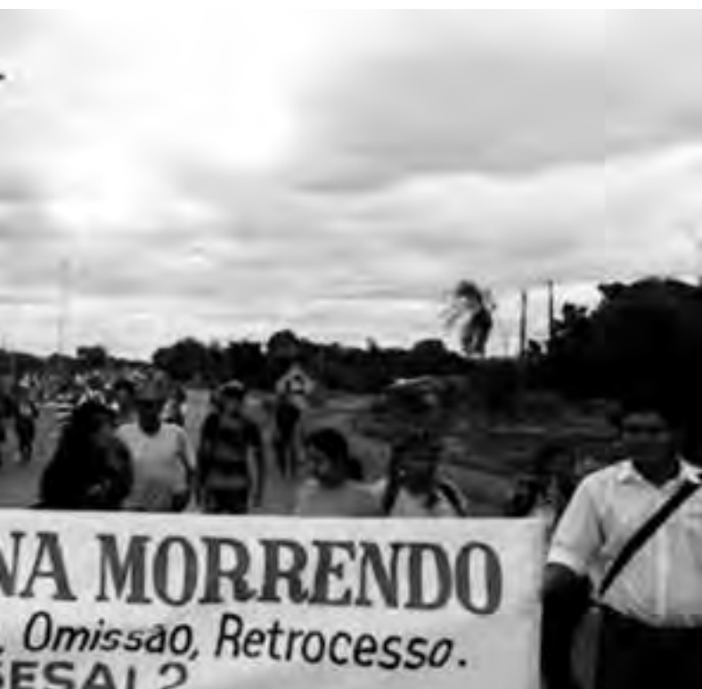
indígena, que quadruplicaram nos últimos anos, mas não chegam nas aldeias nem nos postos

DESCRIÇÃO: A indígena vinha passando por um processo de infecção e estava perdendo muito sangue há vários dias. A situação foi se agravando e a vítima esperou por um atendimento no Polo Base, que não ocorreu. Acabou indo ao médico em Aracajú, que atestou a gravidade do problema de saúde. Após ser medicada e retornar à aldeia, foi informada de que não poderia usar o carro da Sesai para retornar a Aracajú, a fim de se submeter à cirurgia necessária para solucionar o