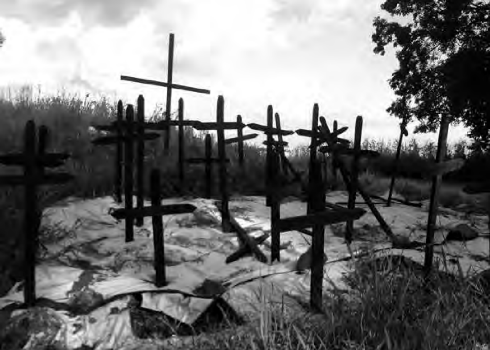
As ações e omissões do Estado brasileiro, especialmente o não cumprimento do dever constitucional de demarcar as terras indígenas, contribuem decisivamente para o agravamento da violência e das violações contra os povos indígenas