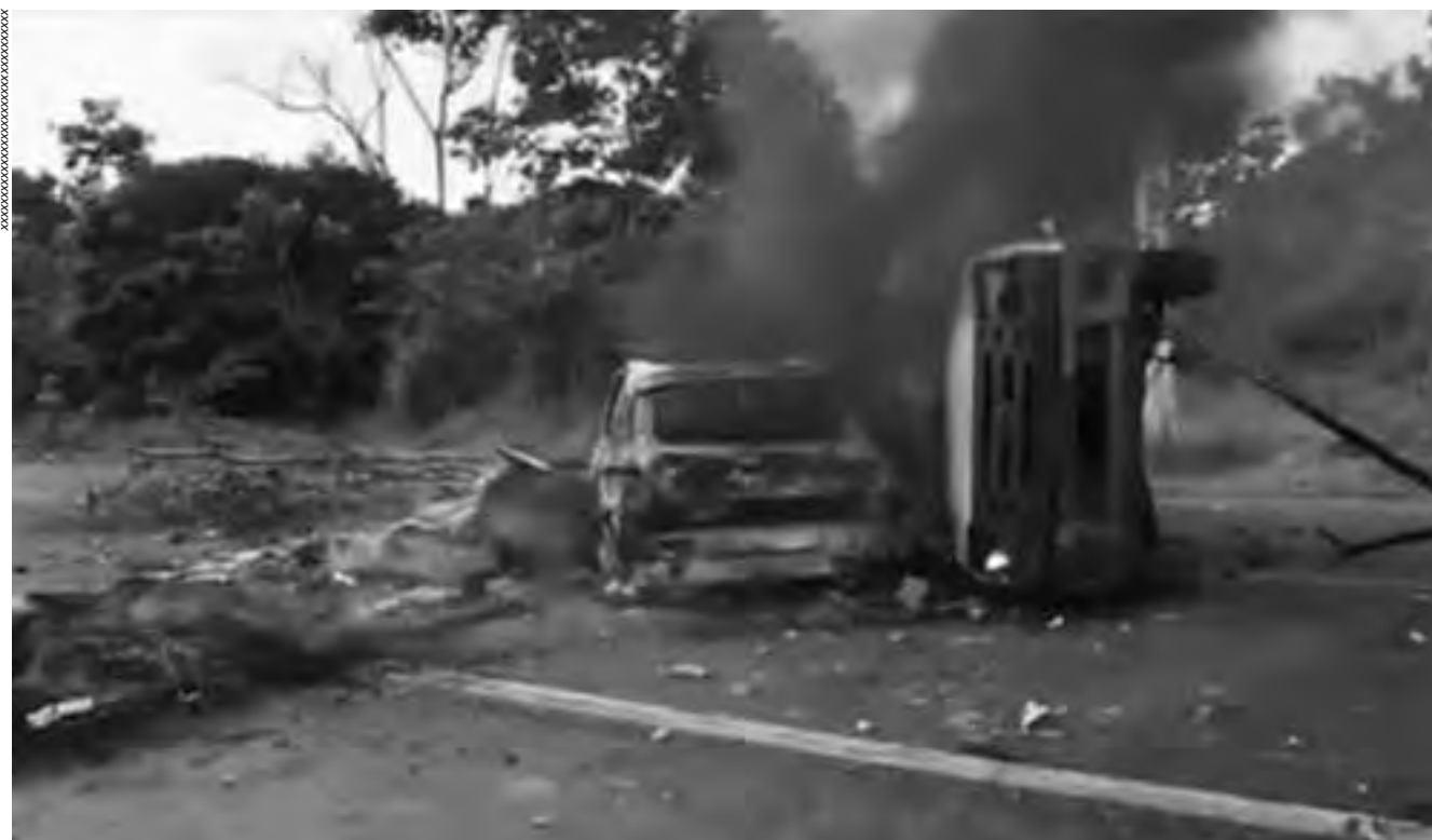
Os atos racistas praticados cotidianamente contra os indígenas em diversas partes do Brasil deixam transparecer o desejo de exterminar aqueles que insistem em ser diferentes

Por fim, deve-se reconhecer que o racismo contra os povos indígenas se expressa tanto por meio de ações de pessoas e grupos, quanto pela omissão do Estado frente às violências praticadas e às reivindicações destes povos para que seus direitos constitucionais sejam respeitados. A violência não decorre da inexistência de mecanismos legais, mas da falta de efetividade destes, agravada imensamente pela inoperância do governo no que tange às demarcações das terras indígenas. Os conflitos fundiários respondem, em larga medida, pelas manifestações anti-indígenas registradas e pela intensificação de uma vontade de exterminar aqueles que, em processos de luta, insistem em manter-se na diferença. ♦