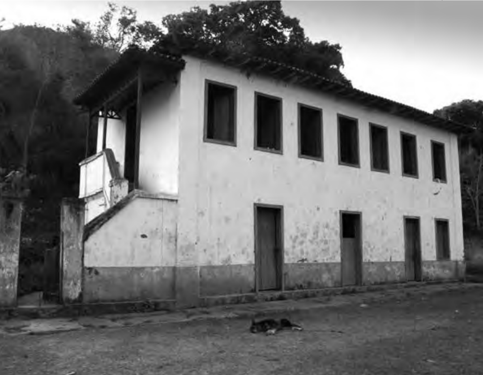
A Fazenda Guarani acolheu indígenas oriundos do Presídio Krenak e de outras regiões, levados para lá por resistirem aos projetos desenvolvimentistas do governo militar