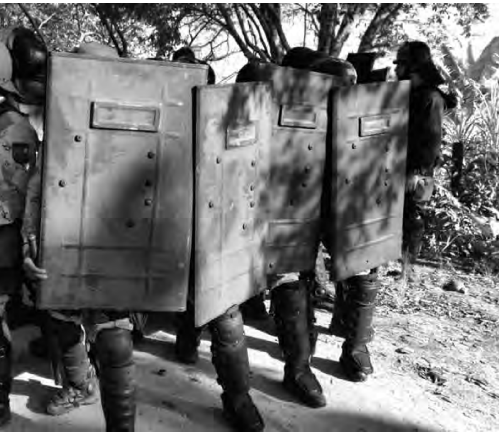
e as criminalizações de lideranças são praticadas contra os povos indígenas desde os tempos da colonização; a novidade é a tentativa de eliminar direitos

discursos racistas, incitando a violência e o ódio contra os indígenas. As organizações indígenas processaram os deputados Luis Carlos Heinze (PP-RS) e Alceu Moreira (PMDB-RS) junto ao Supremo Tribunal Federal (STF) 7 . O primeiro acometimento pernicioso foi o racismo e a incitação ao ódio e à violência cometidos pelos dois deputados federais, e o segundo foi a inadmissibilidade da medida judicial pelo STF com o fundamento da ilegitimidade dos índios para propor o pleito, com base na já revogada tutela e na total desconsideração dos artigos 231 e 232 da Constituição Federal, de 1988.