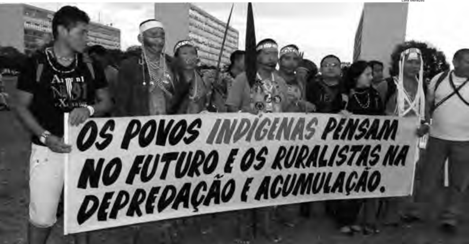
Os povos indígenas têm valores e projetos de vida totalmente distintos dos que são comuns na sociedade ocidental, fundamentada no capitalismo e na mercantilização da vida