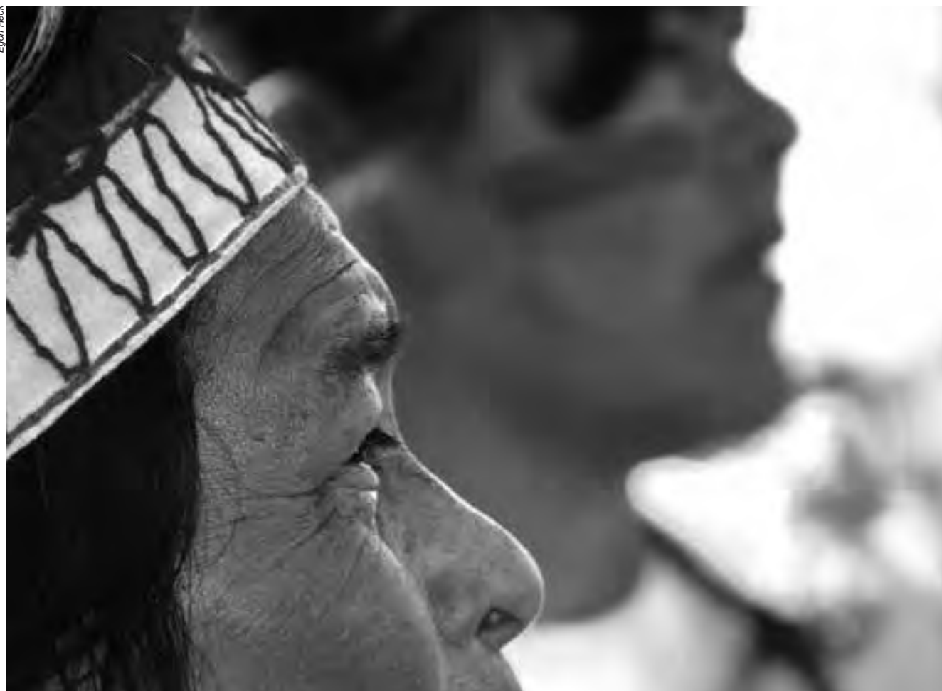
Os ataques, perseguições e ameaças aos povos indígenas no Mato Grosso do Sul são cotidianos; as comunidades que vivem em acampamentos são as mais vulneráveis

No Rio Grande do Sul, indígenas do povo Kaingang foram alvejados por tiros durante uma ação truculenta da Polícia Militar do estado. No mesmo episódio, parentes das vítimas baleadas se dirigiam para o hospital para ter notícias dos indígenas hospitalizados, quando foram interceptados por policiais que estavam em outro veículo da PM. Os policiais dispararam vários tiros contra o veículo. Uma indígena ficou ferida em função dos estilhaços de vidros das janelas e do para-brisa atingidos pelos disparos.