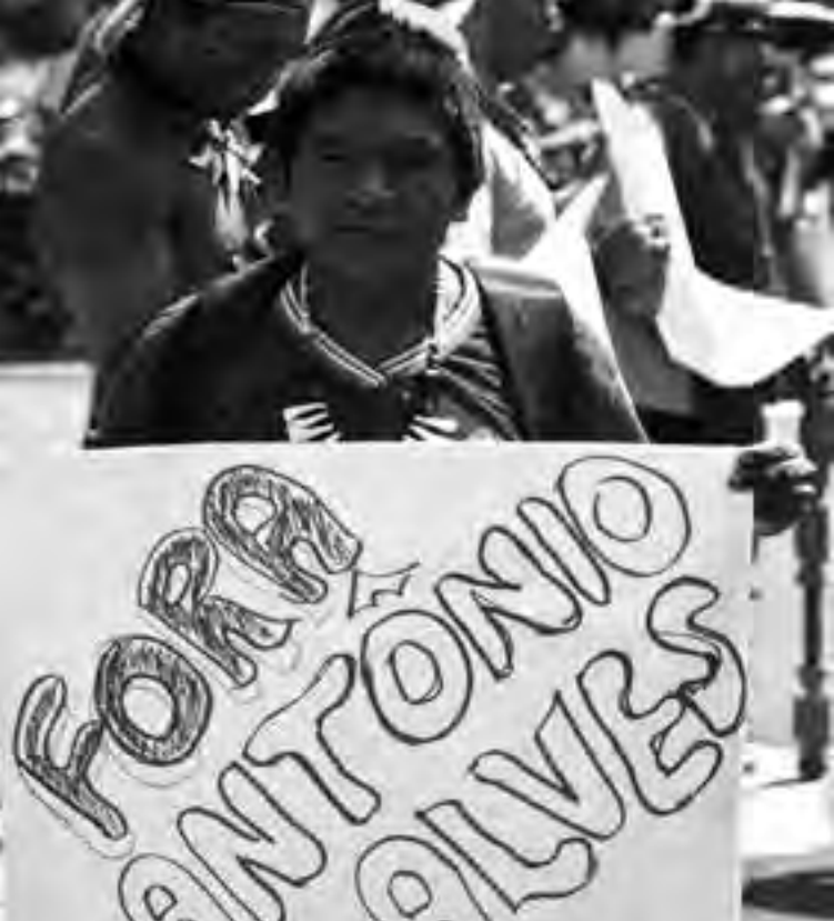
Protestos foram feitos em todo o Brasil contra a criação do Insi que, além de ser inconstitucional, significa a privatização da saúde indígena

Denúncias, oriundas especialmente de representantes de Distritos Sanitários Especiais (Dsei) contrários ao Insi, afirmam que as “consultas” aos povos foram conduzidas de forma autoritária e antidemocrática, e recheadas de ameaças de demissão. Muitos processos de cooptação, manipulação e outros tipos de ameaças contra os indígenas críticos ao Insi também foram reportados por indígenas de todo o Brasil.