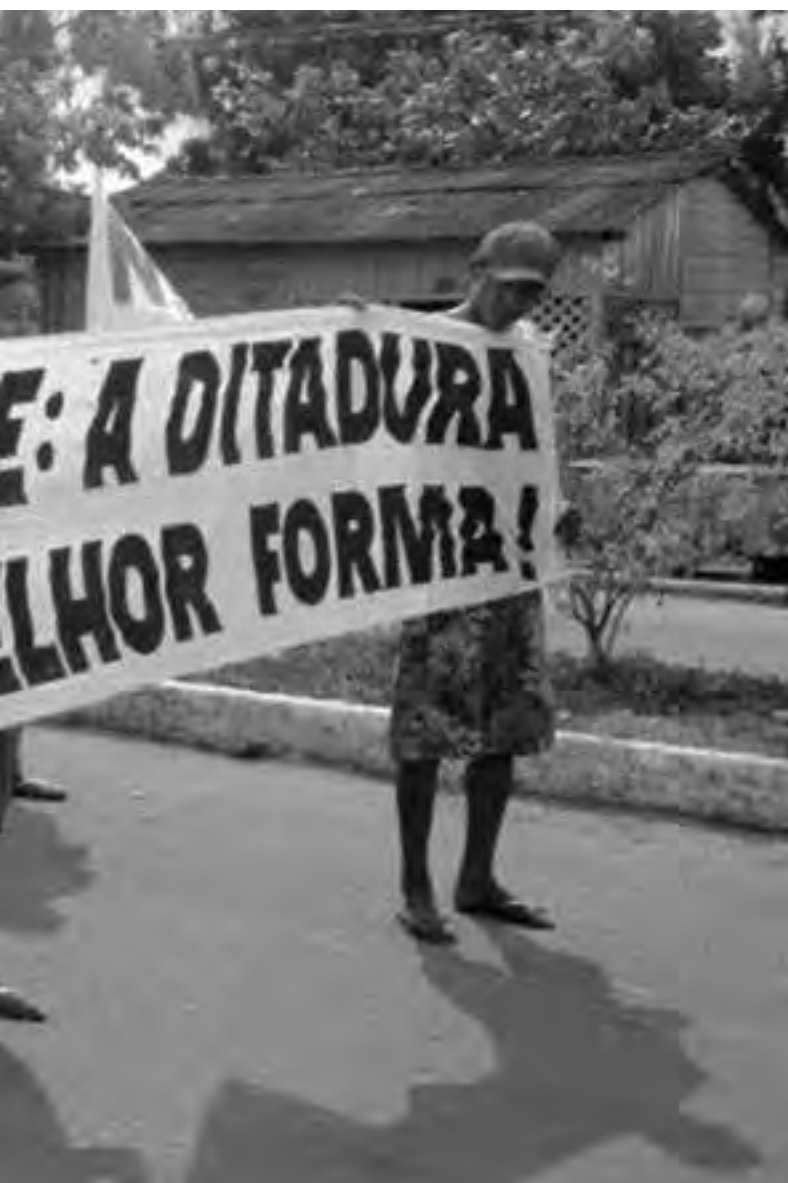
econômicos e políticos, um explícito interesse na apropriação das terras tradicionais

governo militar. Nesse contexto, não poderiam estar mais atuais as palavras do ministro do Interior Rangel Reis, em 1976, quando afirmou que “os índios não podem impedir a passagem do progresso”.