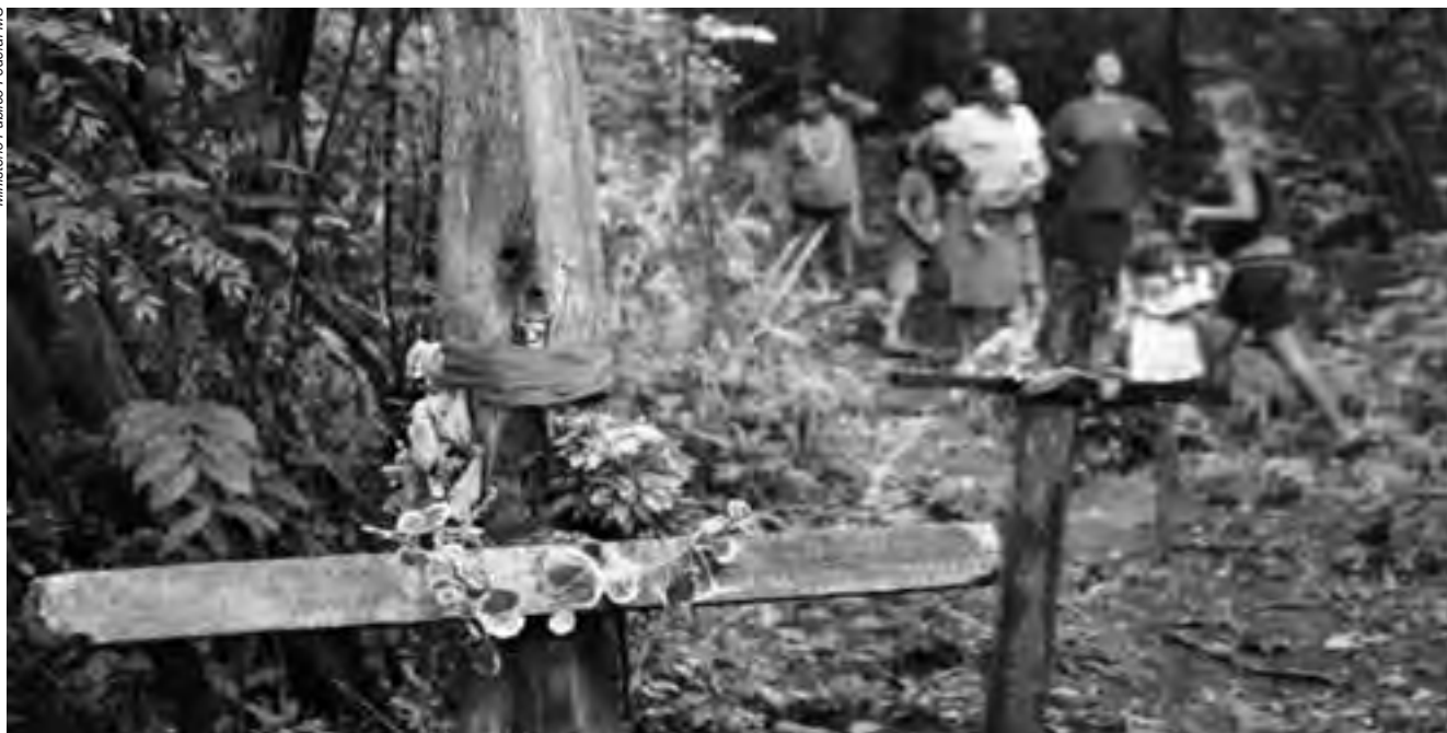
Ao deixar de cumprir suas atribuições vinculadas à defesa dos direitos indígenas, o Estado passa a ser responsável direto pelos homicídios e crimes praticados contra esses povos

Pelo menos 21 mortes ocorreram em decorrência de brigas e/ou consumo de álcool. Em seis casos as mortes ocorreram diretamente em virtude de conflito fundiário. Predominou o uso de armas brancas, com 20 casos, e armas de fogo, com 25 ocorrências.