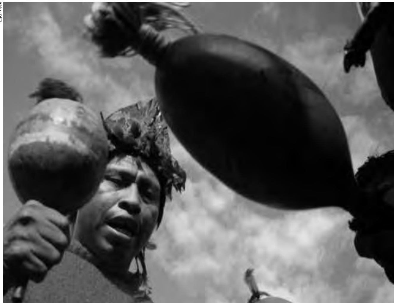
No Brasil, indígenas ainda morrem por falta de assistência básica, de medicamentos, devido ao consumo de água imprópria e por doenças de fácil tratamento

Contudo, os medicamentos, a infraestrutura para o atendimento e a equipe técnica não eram suficientes para prestar o devido atendimento ao conjunto dos enfermos. Segundo o CTI, seriam necessários mais médicos, técnicos de enfermagem, medicamentos, viaturas e medicamentos para conter o cenário. Segundo dados oficiais, nove indígenas vieram a óbito entre os dias 25 de novembro e 16 de dezembro. Os Canela, no entanto, consideram este número subestimado e afirmam que 19 indígenas faleceram nesse período. Cerca de 310 indígenas estavam recebendo tratamento.