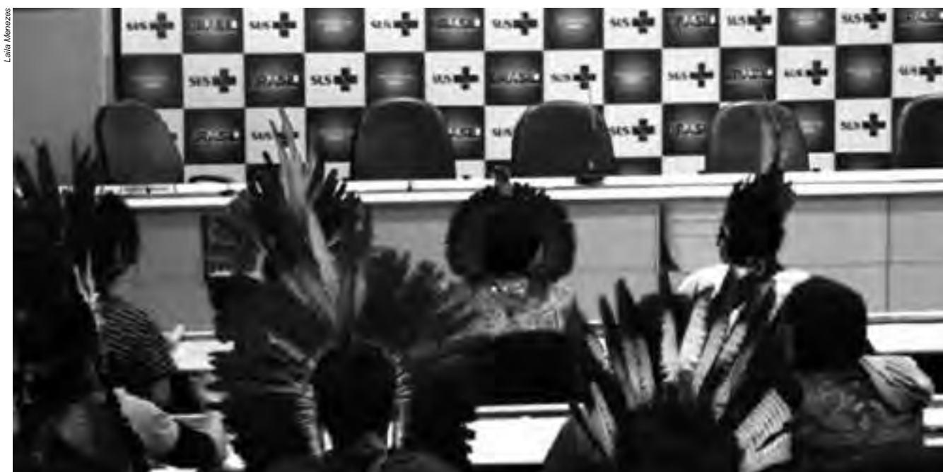
A proposta de criação do Insi desconsidera um longo processo de mobilização do movimento indígena em todo o país que visou o reconhecimento da saúde indígena como uma política pública

Diversas organizações e lideranças indígenas manifestaram repúdio a esta iniciativa do governo. Dentre elas estão: Articulação dos Povos Indígenas do Brasil (Apib); Coordenação das Organizações Indígenas da Amazônia Brasileira (Coiab); Articulação dos Povos e Organizações Indígenas do Nordeste, Minas Gerais e Espírito Santo (Apoime); Articulação dos Povos Indígenas da Região Sul (Arpinsul) e o Conselho Indígena de Roraima (CIR).