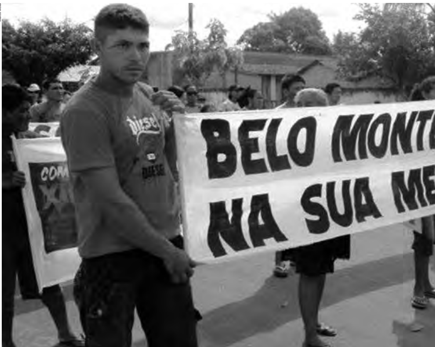
Desde a época da ditadura os povos indígenas são considerados obstáculos ao “desenvolvimento”; sempre houve também, por parte dos mais diversos grupos

o parágrafo 6º do Artigo 231 da CF, a fim de restringir o uso exclusivo dos índios sobre suas terras. Ainda em 2012, a Advocacia Geral da União (AGU) publicou a Portaria nº 303, com o argumento de “Salvaguardas Institucionais às Terras Indígenas, conforme entendimento fixado pelo Supremo Tribunal Federal na Petição 3.388 RR”. Através desta portaria, o Executivo federal buscou aplicar a todas as terras indígenas o entendimento do STF exclusivo para o processo de demarcação da Terra Indígena Raposa Serra do Sol (RSS), ficando explícita intenção de restringir os direitos indígenas