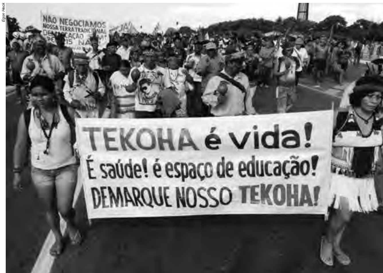
A demarcação das terras indígenas deve ser a primeira ação de reconhecimento da dívida histórica que o Brasil tem com seus povos originários

contestações e 60 dias para análise da Funai, o procedimento demarcatório ainda aguarda a portaria declaratória, a ser assinada pelo ministro da Justiça. Já são cinco anos de espera.