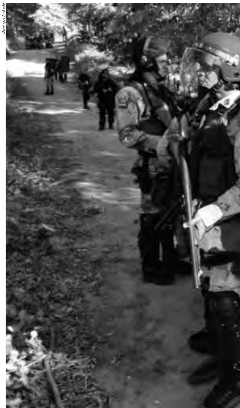
A institucionalização da violência, a utilização de violência privada, as recorrentes violações

A violência contra os indígenas assume mais de uma faceta, e quase sempre institucionalizada: a marcha das bancadas ruralistas, economicistas e conservadoras segue no curso inverso ao da concretização de preceitos constitucionais, pois adota posição explicitamente genocida, tendo como efeito o extermínio da pluralidade social e cultural no Brasil 2 ; as ações de órgãos indigenistas estatais são imprecisas e políticas públicas, como saúde e educação, não são efetivamente aplicadas; a demarcação das terras indígenas foi barrada pelo poder Executivo; o Judiciário vem anulando portarias declaratórias que rigidamente seguiram o rito do Decreto 1.775/1996, causando grave prejuízo ao erário e, é claro, às comunidades 3 ; e, entre as mais nocivas estão as ações truculentas do Estado, sempre ocasionando graves violações aos direitos humanos, com reintegrações de posse cumpridas de forma violenta e ações que culminam até mesmo na morte 4 e tortura de indígenas 5 . Por último, resta mencionar a chamada violência privada, com o ressurgimento de milícias, jagunços e até empresas de segurança, que atentam contra a vida e a integridade física dos indígenas 6 .