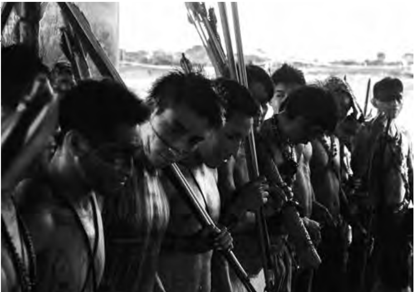
Lideranças Munduruku que participavam de protestos na cidade de Jacareacanga pela melhoria da educação escolar indígena foram ameaçados por moradores locais e atingidos por rojões