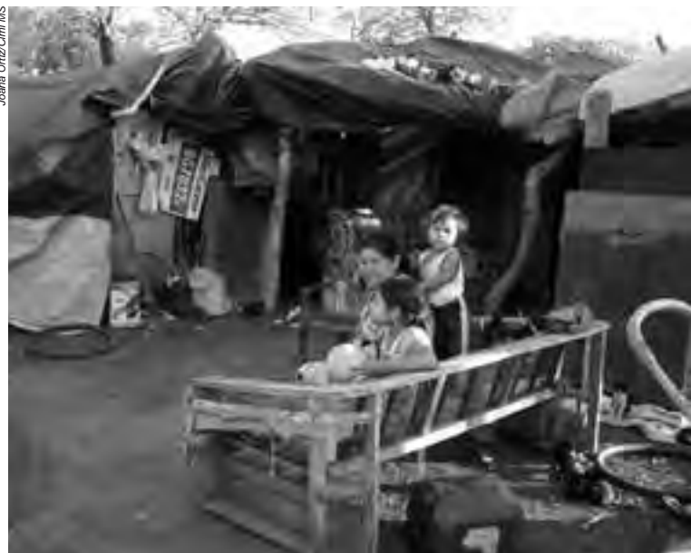
Acampados na beira de estradas por décadas, os indígenas vivem em condições degradantes, mas não desistem da luta por seus territórios ancestrais

da Constituição Federal e das normas infraconstitucionais. O Poder Legislativo, além de dar sinais de subserviência a grupos econômicos, não promove a fiscalização sobre o Poder Executivo para que este cumpra suas atribuições, resguardando os direitos indígenas e coibindo a exploração das terras indígenas e a expropriação de seus bens naturais, como a água, a madeira e os minérios.