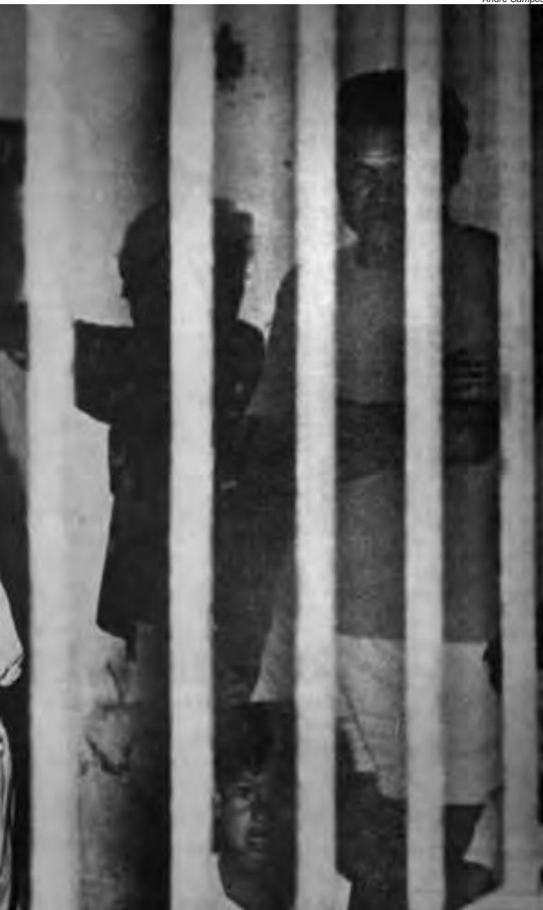
Espancamento e confinamento compunham o cotidiano da colônia penal, que foi denunciada pelo jornal Porantim , na época, como um “Campo de Concentração Indígena”

e humanista, no geral”, e avaliaram que a fazenda não era adequada para uma área indígena. Consta nesse relatório que eles identificaram 49 Krenak, 35 Pataxó, três Guarani, além de indígenas de outras etnias, como Xerente e Pankararu. Parte do grupo Guarani já havia retornado ao Espírito Santo.